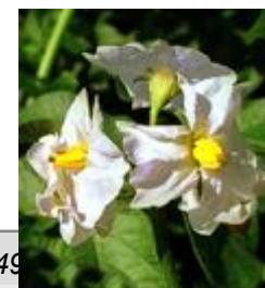
Flower and Light Sprout SOLIST NN